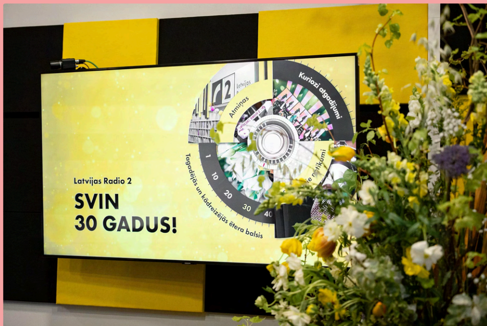
2025. gadā LSM atzīmēja Latvijas Radio 2 30 gadu jubileju, kā arī Latvijas Radio simtgadi.