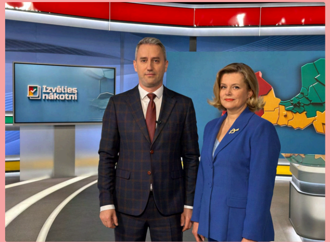
Sabiedriskie mediji 2025. gadā īpašu uzmanību veltīja pašvaldību vēlēšanām, veidojot speciālu saturu un priekšvēlēšanu debates par katru Latvijas novadu.

LSM nav izdevies sasniegt Padomes noteiktos mērķus un panākt sabiedrības augstāku vērtējumu attiecībā uz jautājumiem, kuri ietekmē indikatoru Demokrātiju un Sabiedrību aprēķinu. Tomēr šajā gadījumā Padome uzskata, ka novirzes definējamas kā nebūtiskas, jo saskaņā ar ekspertu atziņām LSM Sabiedrības un Demokrātijas virzienā lielā mērā sasniedz mērķi, atainojot sabiedrību un dažādās tās grupas, kā arī iesaistot dažādas sabiedrības grupas satura veidošanā. Tāpat arī neatkarīgs pozitīvs eksperta vērtējums saņemts par LSM darbību pašvaldību priekšvēlēšanu satura veidošanā. Padomei nav pamata apstrīdēt ekspertu vērtējumu.