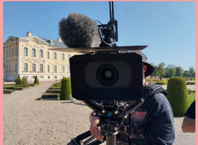
2025. gada dokumentālā filma "Rundāles pils dārzs. Četri gadalaiki." poētiskā veidā atklāj Baltijā ievērojamākā vēsturiskā baroka dārza rašanos, pārveidi un atjaunotni.