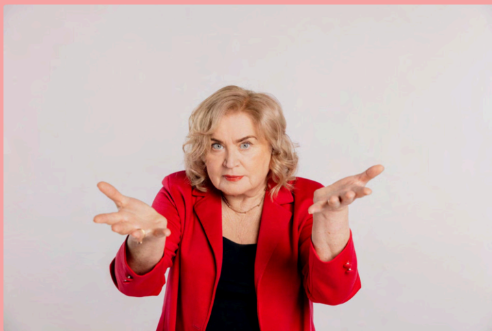
Rudenī LTV sākās senioru iepazīšanās raidījums "Sirdslietas", kas pievērta uzmanību vientulības problēmai un aktīvas dzīves iespējām arī gados vecākiem cilvēkiem, mazinot aizspriedumus par vecumu un cilvēka spēju pilnvērtīgi piedalīties sabiedrības dzīvē. Šovu pavadīja plašs saturs portālā LSM.lv.

Pozitīvāk eksperti – un arī iedzīvotāji aptaujā – vērtē LSM darbību jautājumos, kas saistīti ar attiecībām ģimenē un sabiedrības veselību, kuri spēj sniegt izsmeļošu un noderīgu informāciju. To apliecina arī iedzīvotāju aptauju rezultāti, kur attiecīgais saturs vērtēts pozitīvāk nekā ekonomikas, finanšu un tiesību jautājumu atspoguļojums.